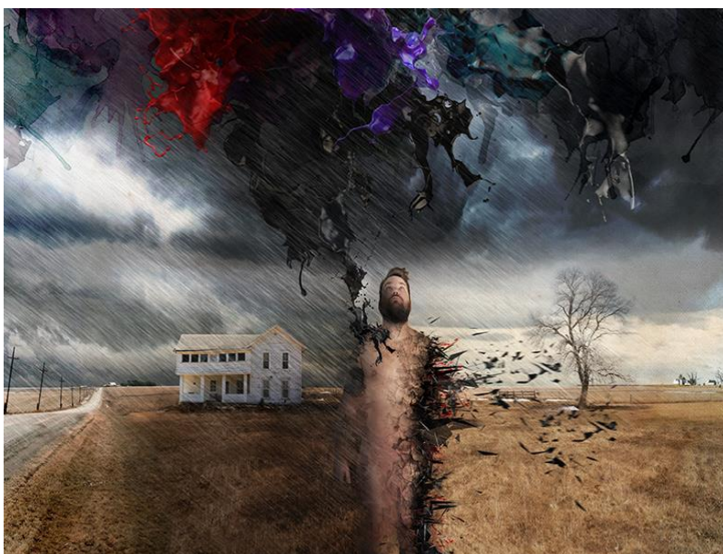
Figura 3. Ilustración del podcast visual Spilled Ink. Imágenes como estas contienen elementos animados que, junto con paisajes sonoros, dan a conocer el espíritu de cada episodio.