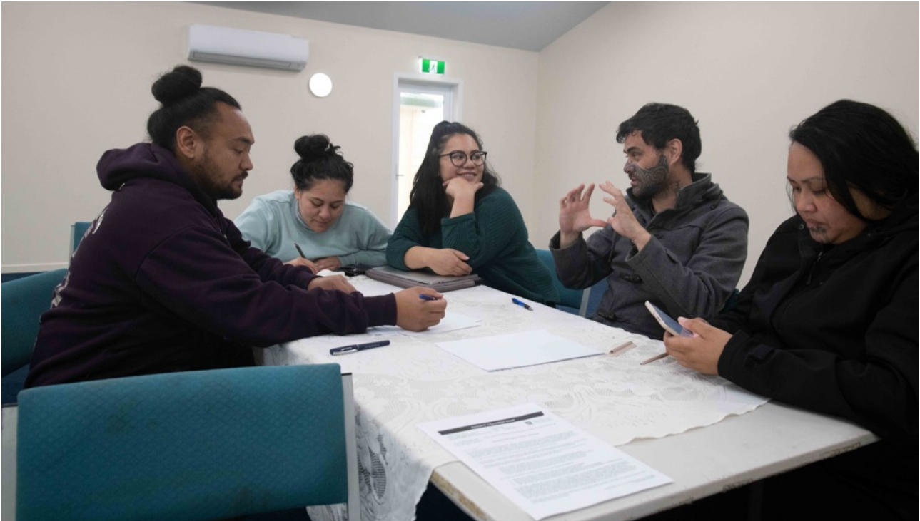
Figure 2. Research participants during Wānanga, used with permission.

Country regions and expanded modes of place representation informed by Waikato-Maniapoto storytelling and Mātauranga. As a consequence, wānanga participants valued the use of photography to (re) tell shared stories and critically reflected on how instrumental the medium and discourse of photography was to assert colonial and imperial aspirations. This was an useful starting point to