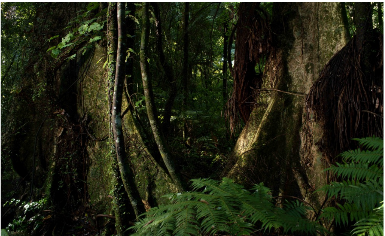
Figure 6. Maungatautari Mountain Sanctuary forest.

Finally, we highlight the climate crisis element of this research by establishing a critique of Eurocentric and colonial views on land and places. We also highlight the severity of the current situation and how vast land areas in the central North Island of Aotearoa have been exploited and destroyed throughout the last century. In this sense, Te Nehenehenui as both place and concept signifies a form of reclamation of ancestral Polynesian views as a way to regain and assert place mana (prestige and power, authority). There is still time to recover the actual physical places and spaces, forests and rivers and our humble efforts here to reassure and reclaim knowledge and stories is hoped to be part of this process.