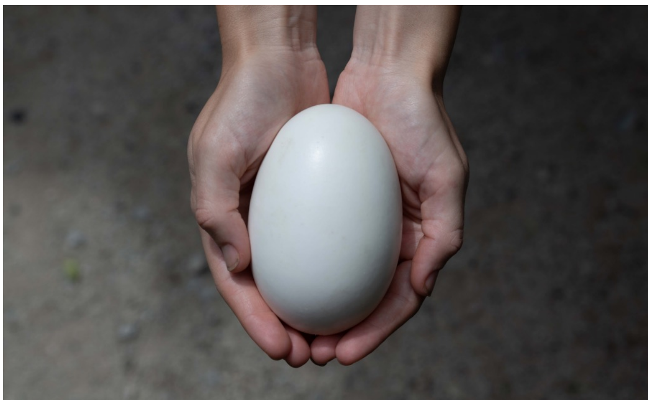
Figura 1. Na concha da mão. Participante da pesquisa segurando a casca de ovo de um passáro Kiwi.

Agora imagine uma fotografia em grande escala: um close-up de mãos em concha segurando um objeto com cuidado, amor e total atenção a ele. A imagem não só nos serve como base para esta pesquisa, mas também como um auxílio visual da maioha de Tawhiao para representar o amor e o cuidado de mana whenua (guardiões da terra) para com suas terras natais. O projeto é essencialmente baseado no ambiente, concentrando-se em Te Nehenehenui e King Tawhiao que se refugiaram nesta região mais tarde chamada de King Country como resultado das invasões britânicas e confiscos de terras na região central da Ilha Norte de Waikato no final do século XIX.