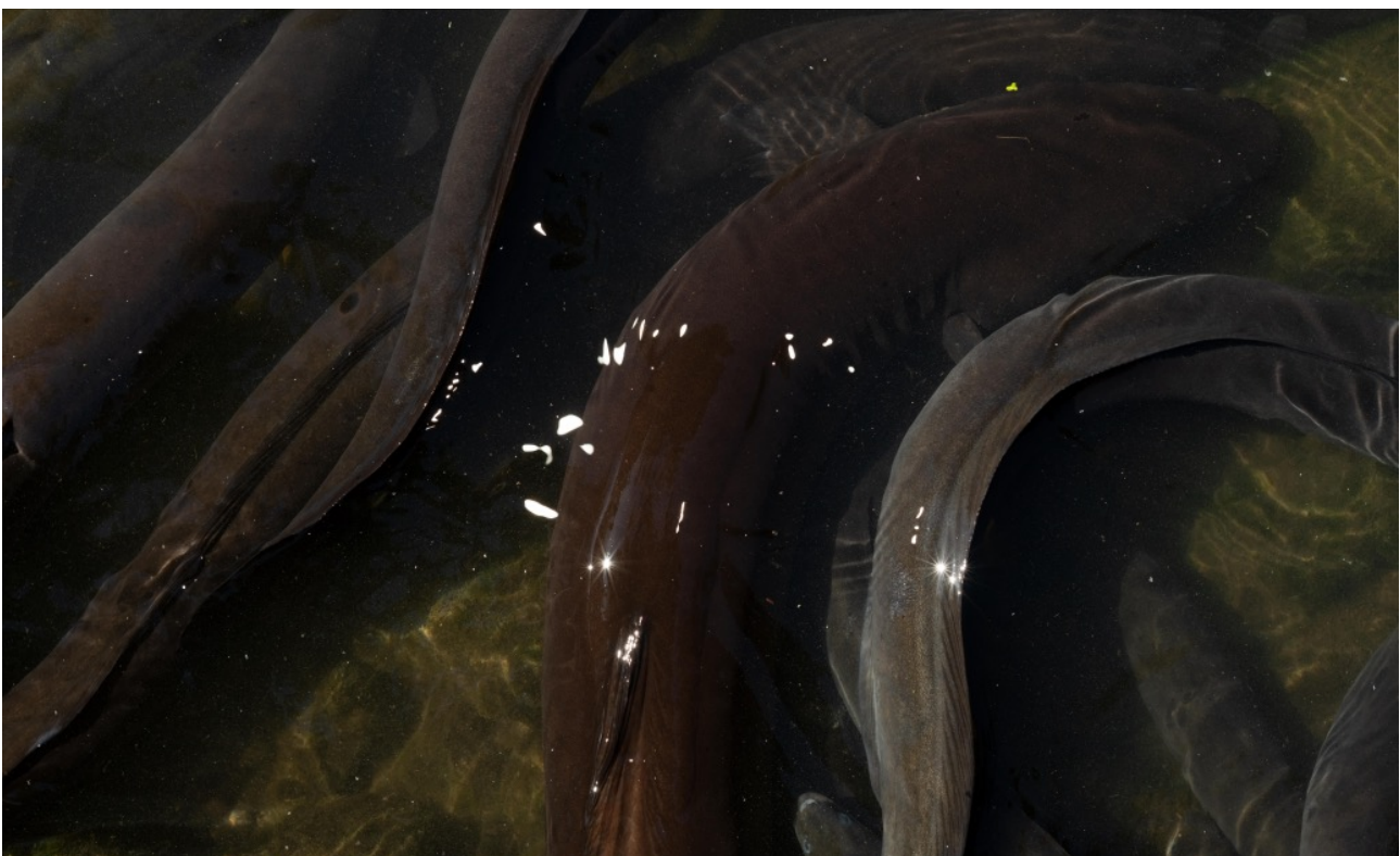
Figura 4. Tuna, enguias.

Nesse sentido, o atum pode ser percebido como uma imagem que encapsula as muitas histórias e cosmologias locais, uma “imagem-pensamento” agora apresentada como uma fotografia abaixo. Expressamos nossa gratidão à Ōtorohanga Kiwi House, que nos deu permissão para visitar e fotografar vários animais nativos abrigados em seu santuário. A imagem abaixo foi criada durante o horário de alimentação, quando vários atuns se aproximaram da borda da água e “passearam” com os cuidadores. Destacamos o amor e o cuidado da equipe da Ōtorohanga Kiwi House com os animais que estão abrigados lá. Na Kiwi House, os atuns geralmente são cuidados até atingirem a idade adulta, para que possam ser soltos de volta em seus habitats naturais. A maioria dos atuns vem de rios e riachos locais. Abaixo segue um dos relatos de Hill sobre o encontro com o atum: