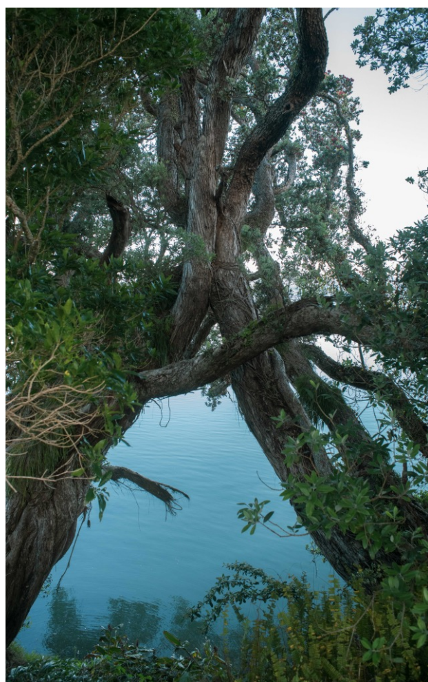
Figure 5. Tangi-te-korowhiti, Kāwhia.

These valuable accounts and wānanga knowledge co-production are extremely important to our research and part of fluid formal and informal exchanges through which Mātauranga Māori is passed on and channelled into photographs. Hill tried to weave (and using the shapes of the tree as a metaphor for it) Māori knowledge threads into thought-images now actualised into the form of a photograph.