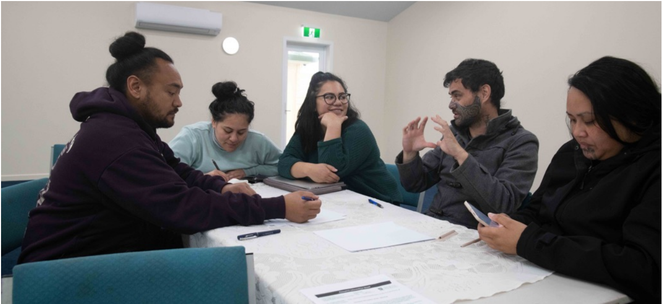
Figura 2. Participantes da pesquisa durante Wānanga, fotografado com permissão.

imagem abaixo, retrata o rio Waipa na cidade de Ōtorohanga, como um reflexo dos relatos de mana whenua. Essa imagem foi fotografada no início de uma manhã de outono durante uma das viagens fotográficas de Hill à região.