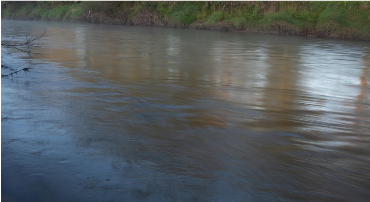
Figura 3. Rio Waipā, Ōtorohanga área central Ilha Norte Aotearoa Nova Zêlandia.

(Dench, 2011; Robertson, 2019b; Schwartz & Ryan, 2003). As práticas fotográficas acima estavam intrinsecamente ligadas aos entendimentos europeus de lugar e paisagem, bem como a uma agenda de estetização e consumo da terra. Além disso, a aristocracia europeia durante o século XVIII desenvolveu uma moda para as grandes vistas. Como explica Wells (2011), “Essa era testemunhou a consolidação dos estilos de paisagem europeus na pintura, na arquitetura e, mais particularmente, no paisagismo, pois a aristocracia e as famílias burguesas ricas encomendaram novas vilas e formalmente projetaram parques e jardins” (p. 28). O ponto de vista de Wells ressoa com o projeto colonial do século XIX dos colonizadores britânicos em Waikato e a inclinação para conquistar, estabelecer e administrar os férteis territórios de terra Māori. Além disso, Simon Dench (Dench, 2011b) explica as influências das representações fotográficas durante a colonização da região de Waikato na segunda metade do século XIX: “O Waikato era um campo de batalha discursivo e militar, e a fotografia estava envolvida em ambas as campanhas interligadas, pois os europeus tentavam reivindicar e justificar o controle sobre espaços reais e simbólicos”. (p. 67)