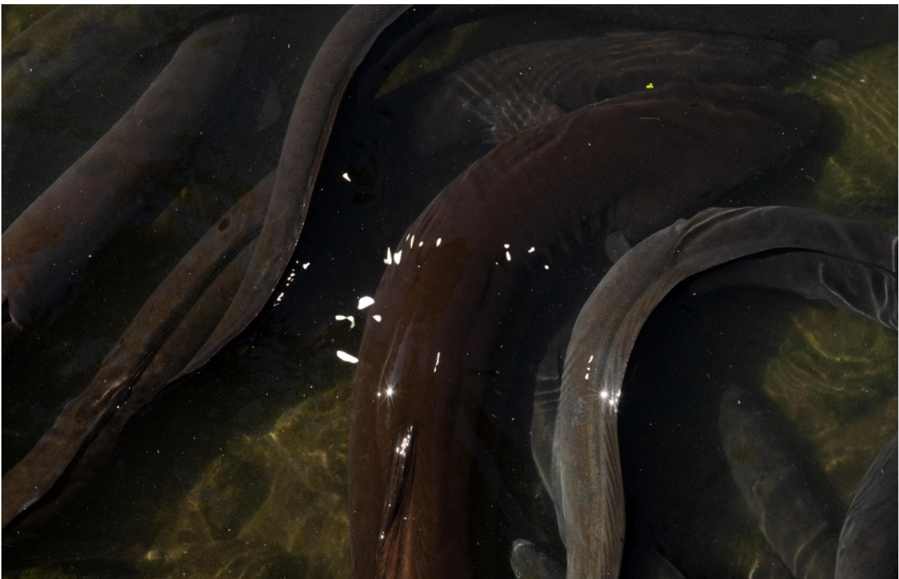
Figure 4. Tuna, eels. Photographed with permission from the Kiwi House Ōtorohanga

In this sense tuna can be perceived as an image that encapsulates the many stories and place cosmologies, a “thought-image” now presented as a photograph below. We express our gratitude to the Ōtorohanga Kiwi House that gave us permission to visit and photograph several native animals sheltered in their sanctuary. The image below was created during feeding time when several tuna approached the water’s edge and ‘hang out’ with the caretakers. We highlight the love and care of the Ōtorohanga Kiwi House staff for the animals that are sheltered there. At the Kiwi House, the tuna are generally looked after until they reach a more adult age so they can be released back into their natural habitats. Most tuna come from local rivers and streams. Below follows one of Hill’s accounts from the tuna encounter.